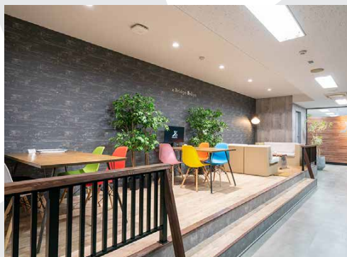
打ち合わせスペース

「xBridge-Tokyo」は、2018年4月「八重洲・日本橋・京橋エリア」にオープンした、創業期のスタートアップ向けシェアオフィスです。様々なノウハウや人脈を持った人・企業が集まるコミュニティを形成し、「人と人」、「スタートアップと既存産業」の架け橋となることで、オープンイノベーションを通じた連続的な事業創出を実現し、スタートアップの飛躍的な成長を後押しするとともに、「xBridge-Tokyo」自身も成長することで、このエリアを日本・世界を代表するイノベーション拠点に位置付けたいと考えています。是非、私たちと一緒にこの「xBridge-Tokyo」を創り上げていただけませんか？